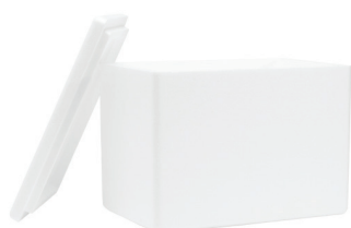
ZHRL112 CL. G.