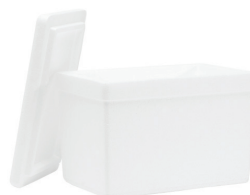
ZHRL113 CL. C.