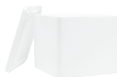
ZHRL111 CAM. V.

Son la solución ideal para los productos que deben transportarse y/o almacenarse de forma segura, por ser sensible a la temperatura, tanto para la industria alimentaria como farmacéutica.